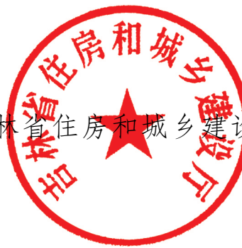
吉林省住房和城乡建设厅