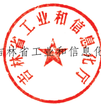
吉林省工业和信息化厅