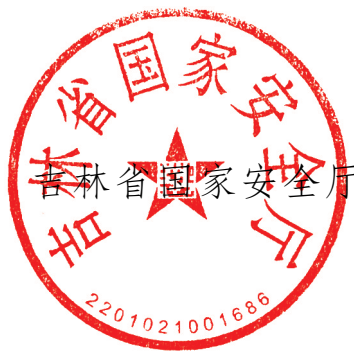
吉林省国家安全厅