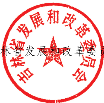
吉林省发展和改革委员会